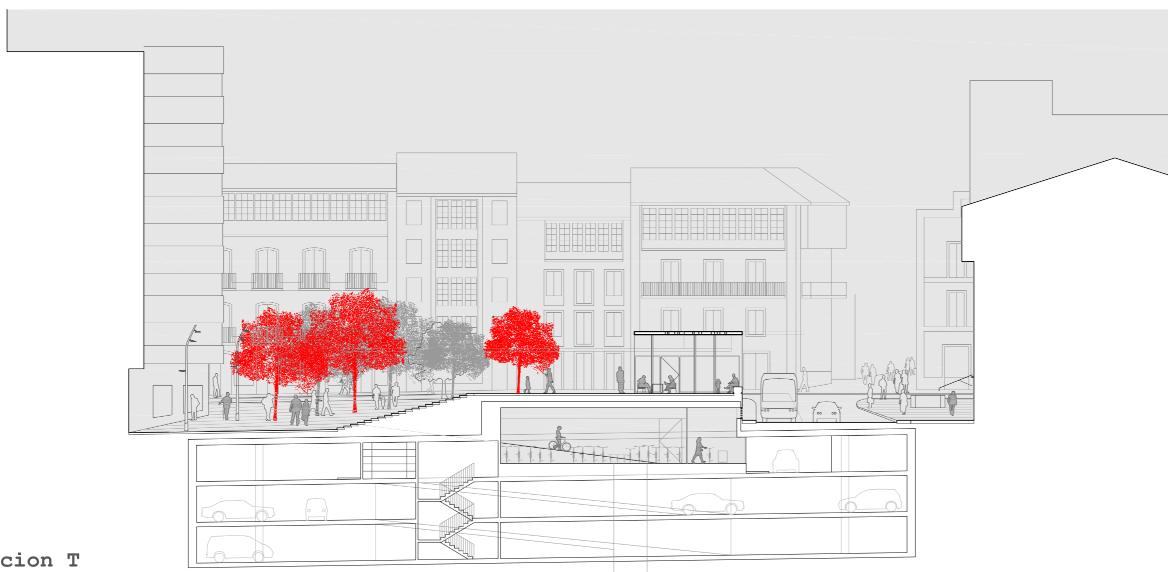
seccion T e 1/250