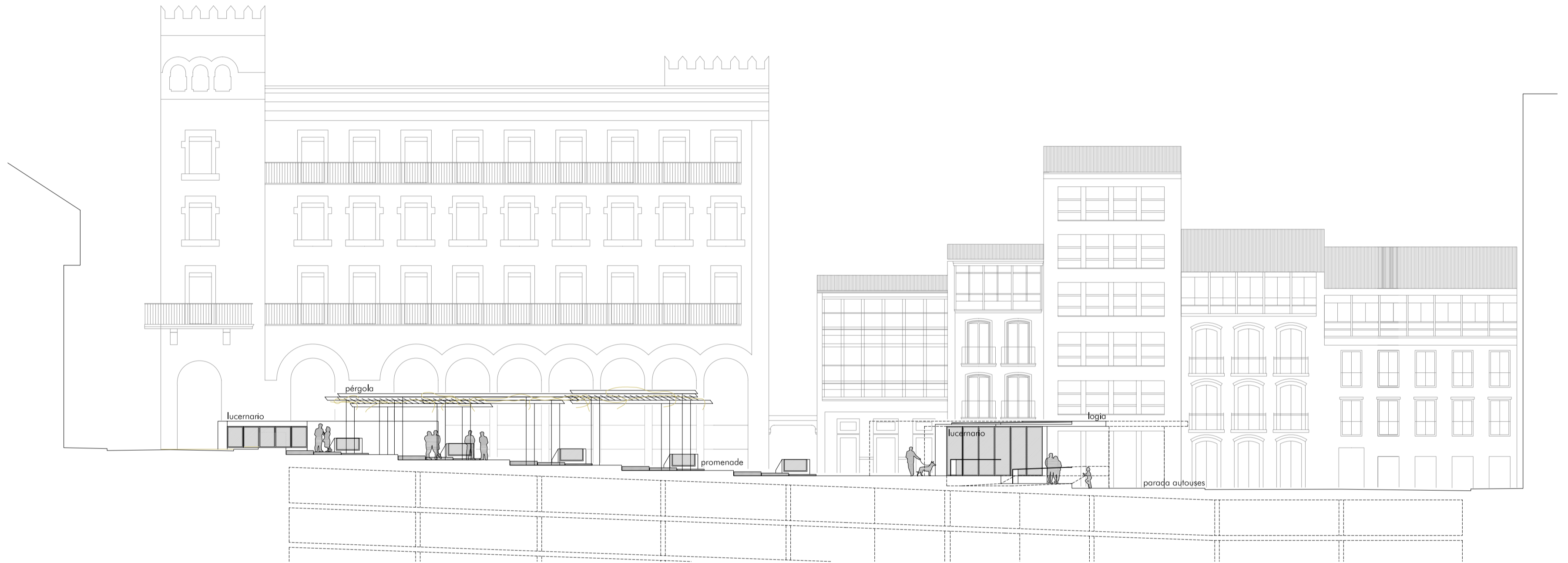
sección longitudinal de la plaza escala 1:200 0 2 4 8 m

la plaza se configura como espacio escenográfico. se accede al casco histórico a través de un propileo , momento de preparación estética y emocional.