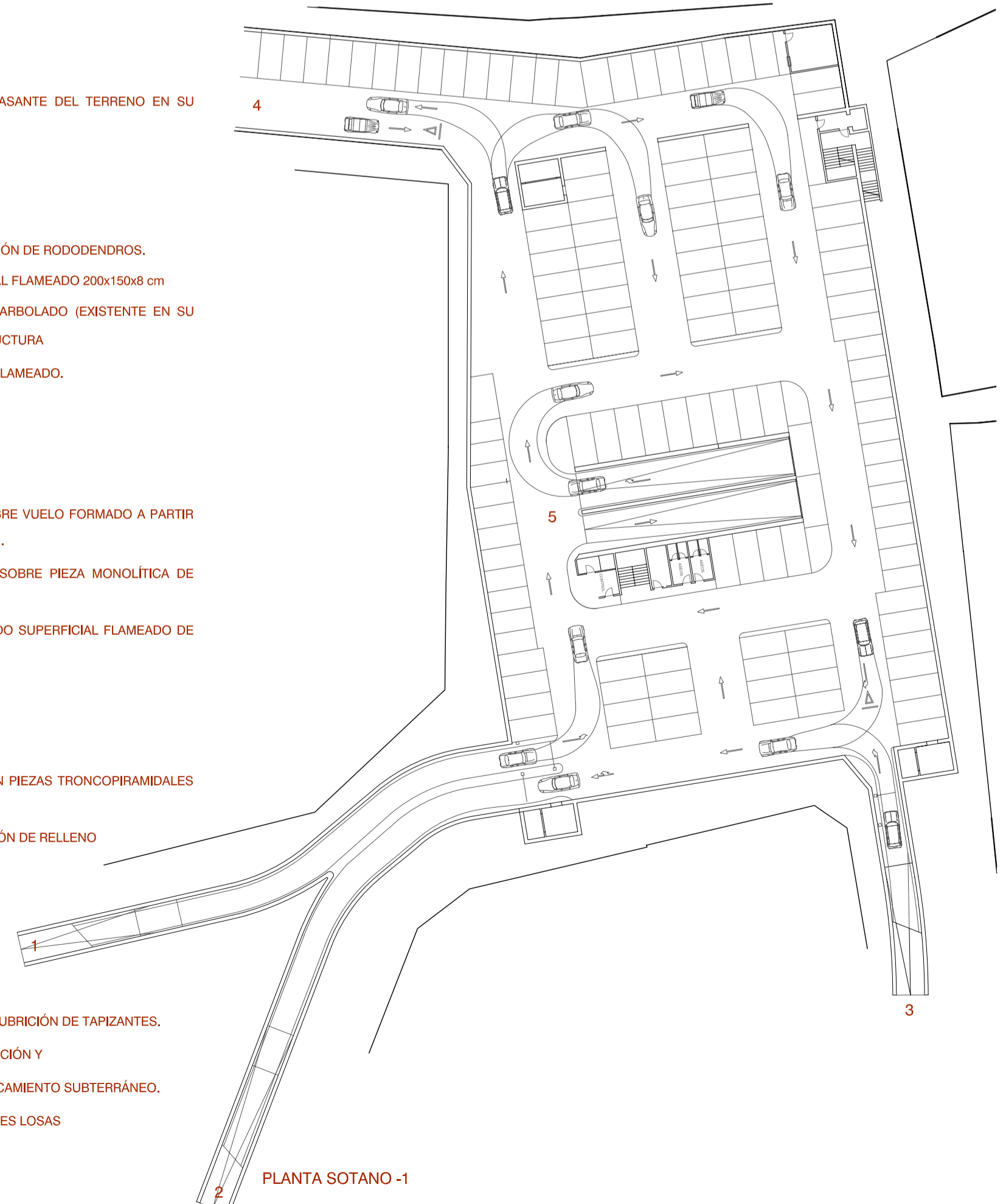
PLANTA SOTANO -1