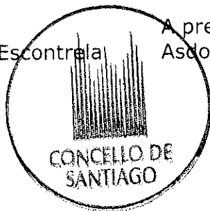
A presidenta do tribunal Asdo/ Montserrat Meijide Munín