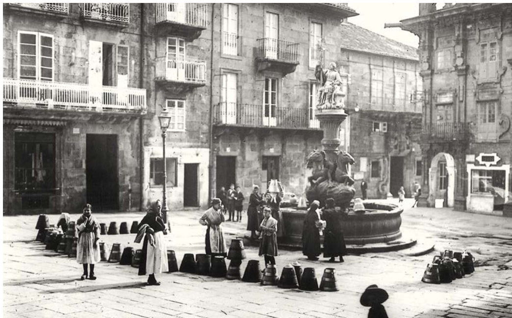
3. Fonte das Praterias ~ P. Mas, 1919