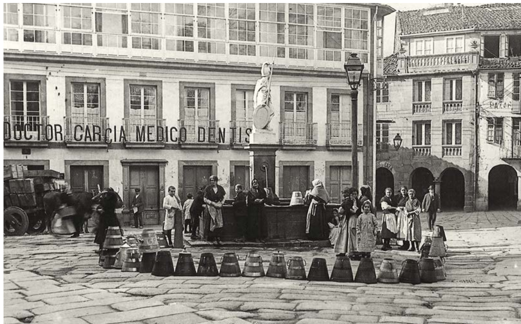
5. Fonte do Toural ~ P. Mas, 1919