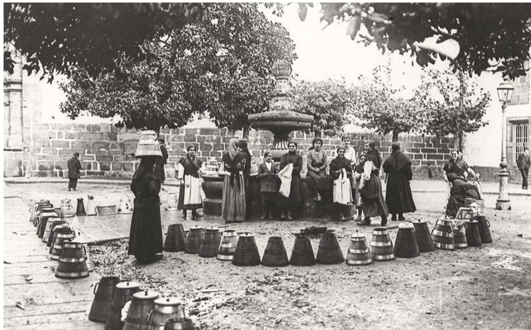
4. Fonte de Mazarelos ~ P. Mas, 1919