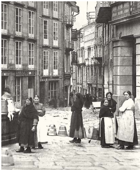
2. Fonte de Cervantes ~ P. Mas, 1919