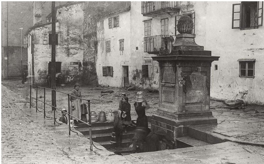
1. Fonte da Porta do Camiño ~ P. Mas, 1919