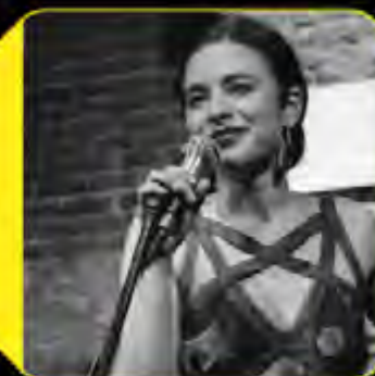
DE MAR A MAR Músicas do Mediterráneo ao Pacífico SÁBADO 01 / 23.00H