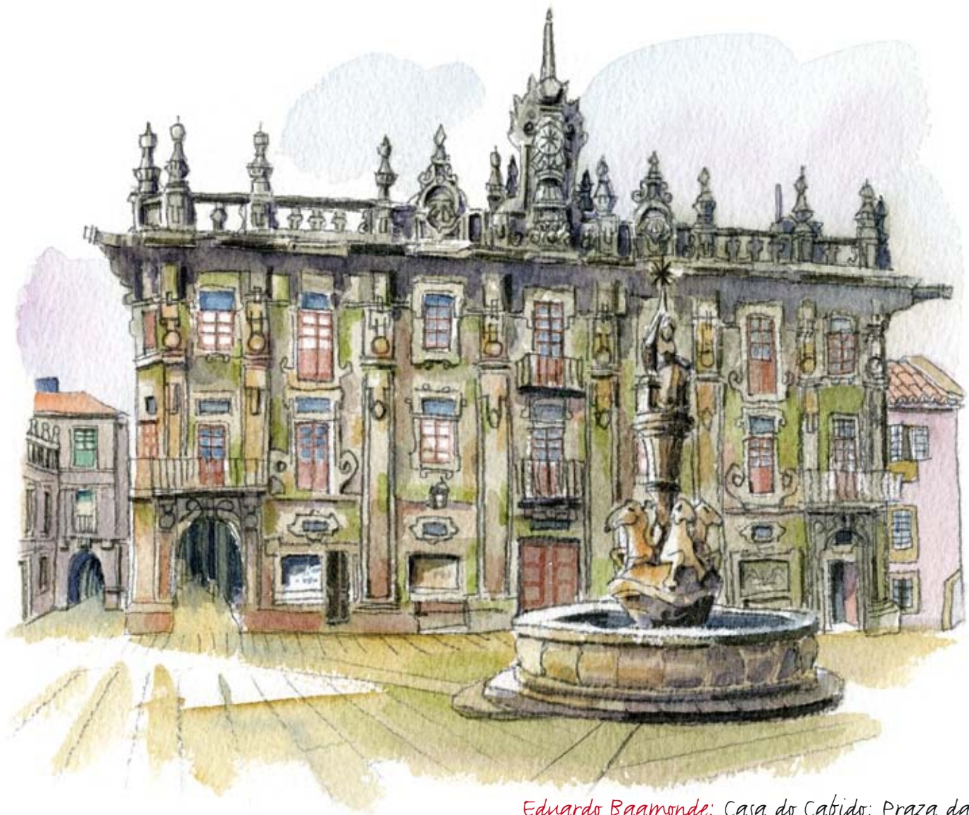
Eduardo Baamonde: Casa do Cabido; Praza das Praterias