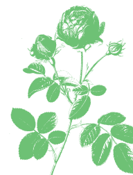
Roseira Rosa sp.