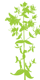
Herba de San Xoán Hypericum sp.