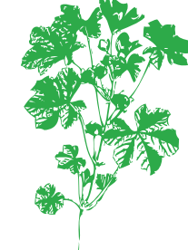
Malva Malva sp.