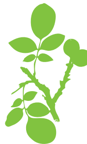
Nogueira Juglans regia

Existe moita variedade ao longo de Galiza nas plantas que se empregan, mais hai o costume de que sexan 7. Aquí indicamos algunhas que poderemos recoller durante o noso roteiro.