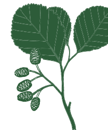
Ameneiro Alnus glutinosa