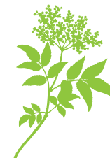
Sabugueiro, bieiteiro Sambucus nigra