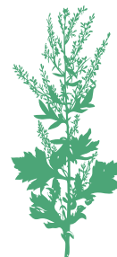
Artemisia Artemisia sp.