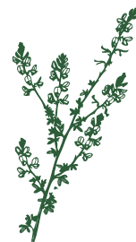
Codeso Adenocarpus lainzii