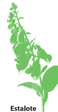
Estalote Digitalis purpurea