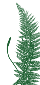
Fento macho Dryopteris sp.